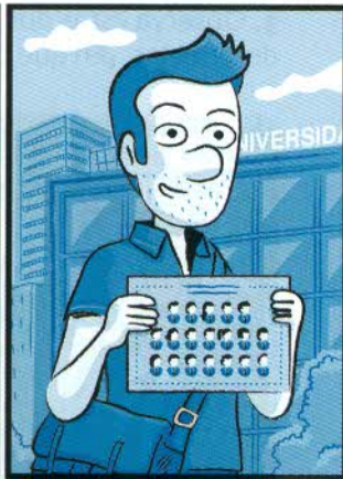
2. Acabo la carrera este trimestre.