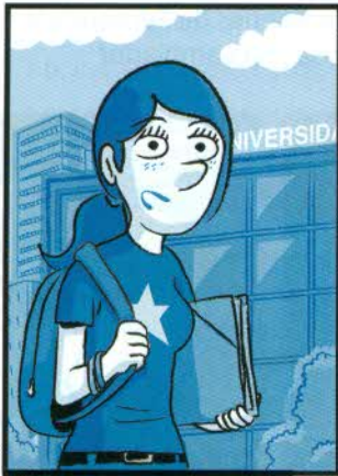
1. Acabo de empezar la carrera.

18. Fíjate en estas frases. ¿Significan lo mismo? Luego, tradúcelas a tu lengua.