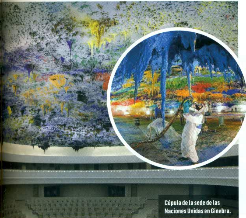
Cúpula de la sede de las Naciones Unidas en Ginebra.

N ació en San Sebastián (País Vasco) en 1969, y pertenece a la cuarta generación de una familia de cocineros.